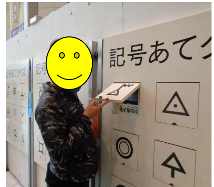
地図と測量の科学館